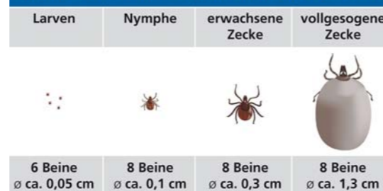
Abbildung 2