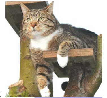
Kater Elvis im Jagdfieber

Es dämmt. Die Nacht kündigt sich an. Noch etwas schlaftrunken springe ich vom Regal. Die Jagdsaison ist eröffnet.