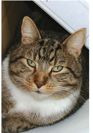
Kater Elvis hat eine neue Freundin.

Ganz langsam schleiche ich die Treppen hinauf. „Ob sie schon wach ist?“, frage ich mich, während ich eine Stufe nach der anderen erklimme. Das Treppenhaus ist dunkel. „Ob ich sie wirklich antreffe?“