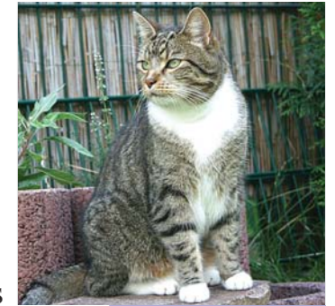
Kater Elvis hatte ungeliebten Besuch.

Unbemerkt habe ich mich ins Haus geschlichen. Leise bin ich durch die Katzenklappe gekrochen, habe den Napf links liegen lassen und bin direkt ins Büro gehuscht. In der Schale meines Kratzbaums habe ich mich verkrochen und so getan, als wäre ich gar nicht da.