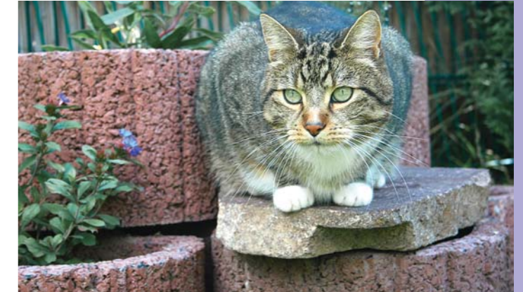
Kater Elvis hat einen neuen Beobachtungsposten.

Ach, was haben sich meine Menschen wieder einfallen lassen! Ganz geschäftig schleppten beide große Steine in den Garten. Hin und her haben sie diese Brocken geschoben. Mit Erde und Sand haben sie hantiert.